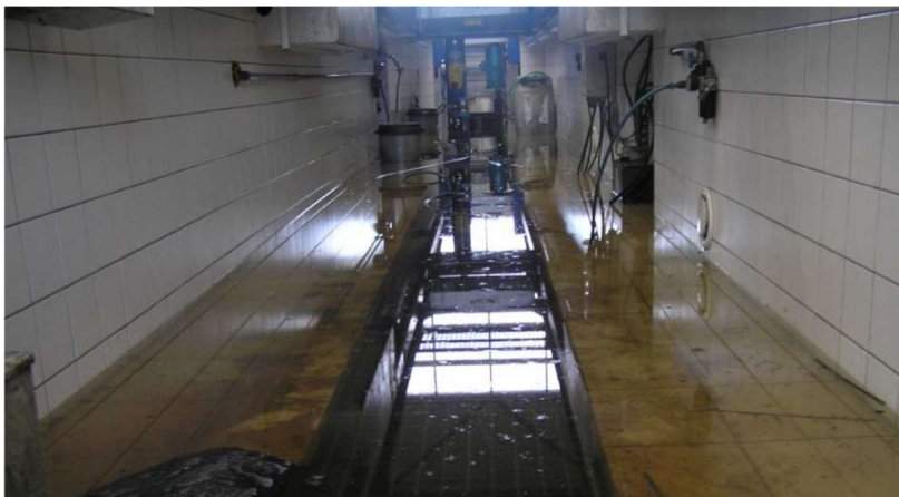
propustnost (zatopení) betonové jámy