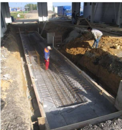
složitě armování betonové jámy