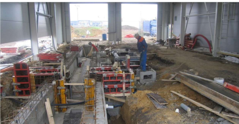
složitě šalování a armování betonové jámy

AUTOTECH - VT, s.r.o., Sokolohradská 866, 583 01 Chotěboř