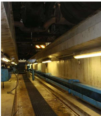
nevhodné osvětlení betonové montážní jámy