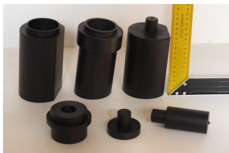
Dodávaná sada lisovacích nástavců